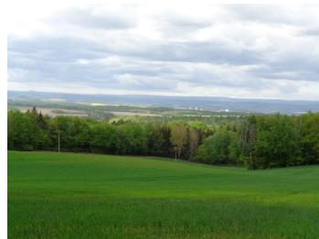
Aussicht Rastplatz Steinelweg/Pirnsche Straße