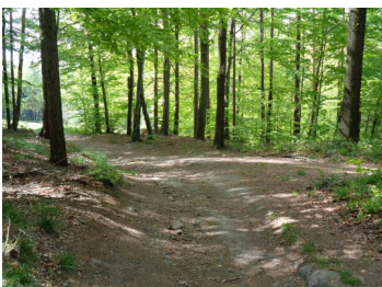
Weg zum Wackelstein hier Rechts