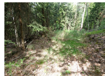
Weg zum Wackelstein Links den Pfad nehmen