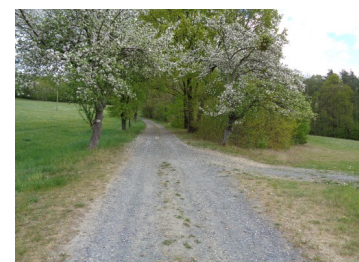
Pirnsche Str. Blühende Obst- bäume (Weg nach Dobra)