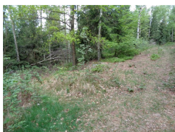
Weg zum Wackelstein hier Links