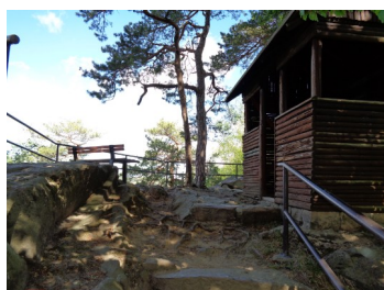
Breiter Stein Gipfel mit Schutzhütte