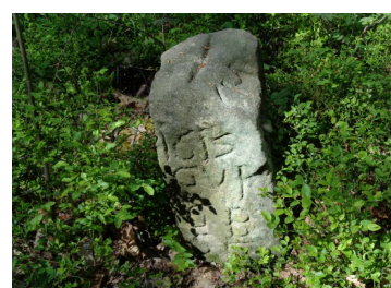
Begrenzungstein am Steinelweg